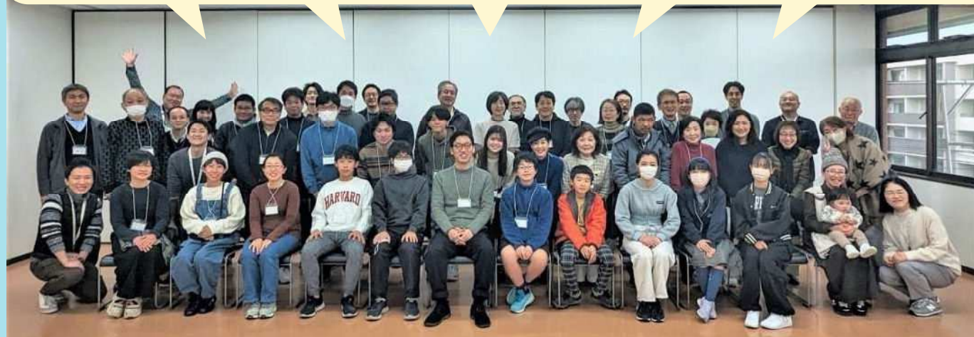
ご参加いただいた皆様、ありがとうございました！