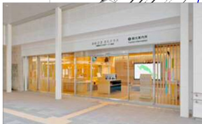
かわさき きたテラス