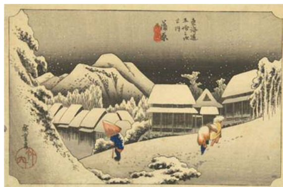
初代歌川広重 東海道五拾三次之内 蒲原 雪之夜