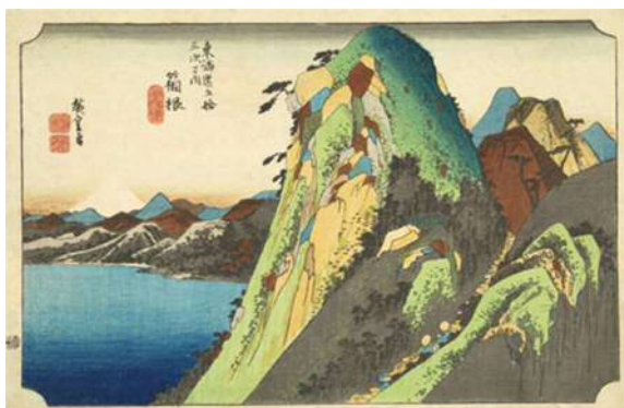
初代歌川広重 東海道五拾三次之内 箱根 湖水図