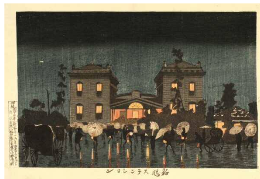
小林清親 新橋ステーション

※ 各展覧会の内容は今後変更となる可能性があります。詳細が決まり次第、別途お知らせします。