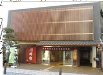
東海道かわさき宿交流館