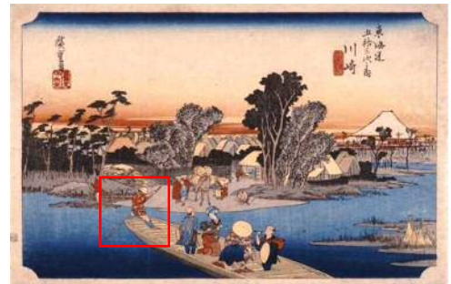
歌川広重(初代)「東海道五拾三次之内 川崎 六郷渡舟」

歌川広重（初代）「東海道五拾三次之内 川崎 六郷渡舟」に描かれている、力を込めて棹をさす「六郷の渡し」の船頭をシルエットとしてデザイン化しました。