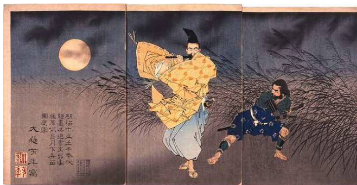
大蘇芳年 藤原保昌 月下弄笛図